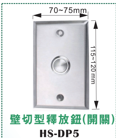
壁切型釋放鈕(開關)